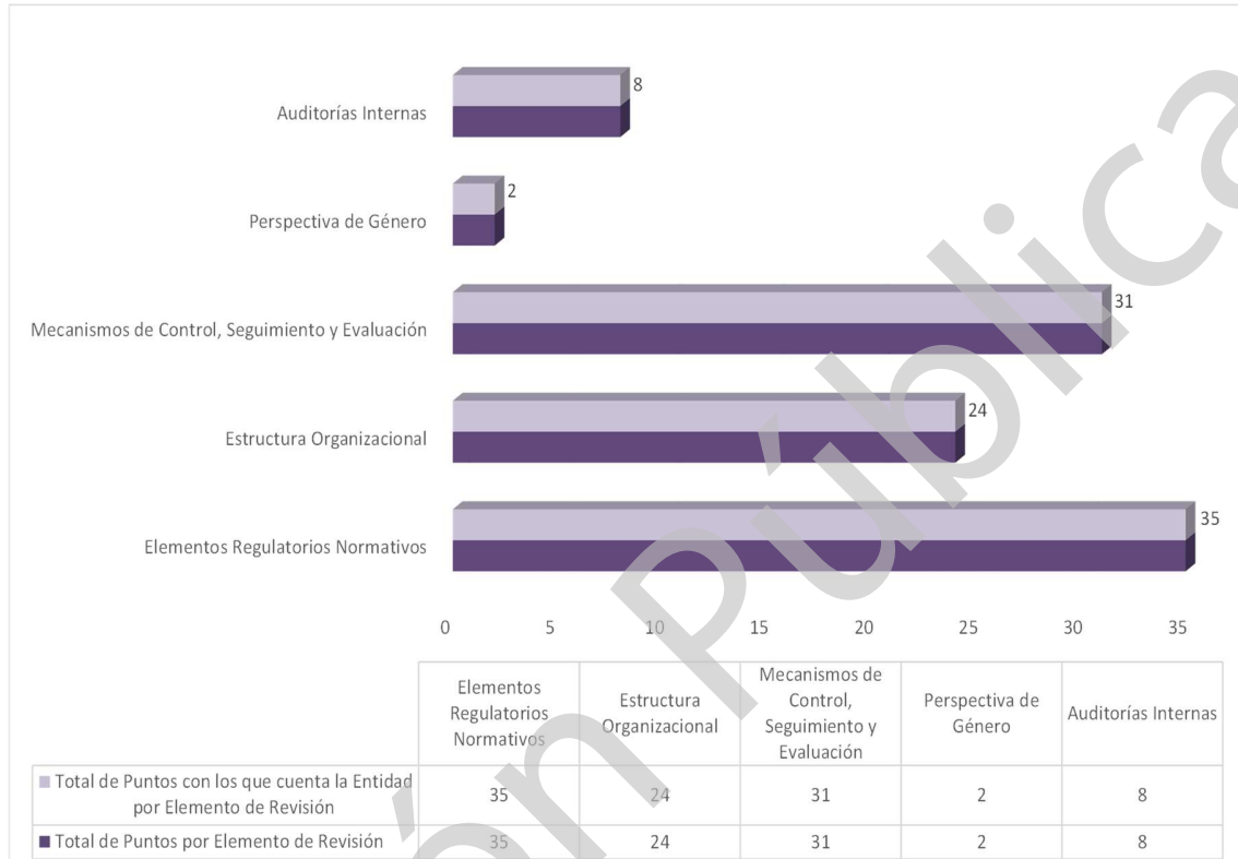
Grafica 1 Cumplimiento de los Mecanismos de Control Interno Ejercicio 2020